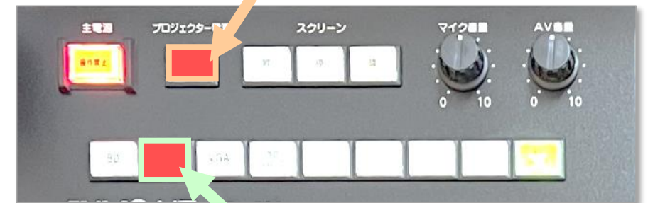
4. HDMI : ON